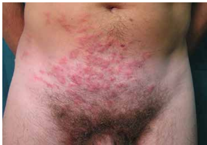
Fig 2. Lesiones múltiples de larvas migratorias en la zona abdominal.

La crioterapia con nitrógeno líquido se puede usar para lesiones pequeñas y aisladas. Hay que hacer tres aplicaciones de 10 segundos cada una, en un área de hasta 0,5-1 cm alrededor de la lesión visible (a menudo la larva llega hasta más allá del borde de la lesión visible). Sin embargo, la crioterapia también resulta ineficaz a veces (en un 25-35 % de los pacientes no hay respuesta, o se dan recaídas). Además, puede inducir