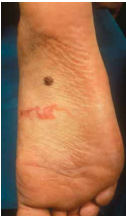
Fig 1. Larva migratoria de afectación cutánea, con la típica marca eritematosa serpenteante, resaltada.

La larva currens se caracteriza por un aumento en las marcas de 5-10 cm/día, urticaria, dolor abdominal, diarrea, eosinofilia periférica, parásitos en heces y respuesta lenta al tratamiento (es muy frecuente que se necesiten varias tandas de tratamiento