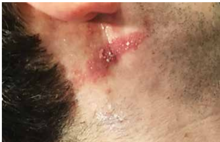
Fig 2. Lesión inflamatoria lineal.