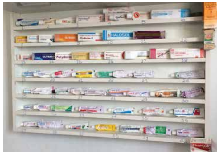
Fig 1. Expositor con distintos tipos de cremas.

Una nueva solución, muy sencilla, es la que ha desarrollado el departamento de dermatología del Hospital Greenpastures