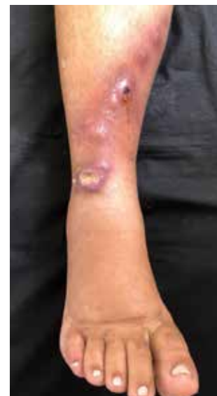
Fig 1. Forma linfagítica de esporotricosis

Es probable que estos datos no reflejen la gravedad de la epidemia zoonótica por esporotricosis en Brasil. En 2018, en el encuentro de la Sociedad Brasileña de Dermatólogos se presentaron 8 pósteres y se realizaron 2 exposiciones orales sobre esporotricosis. La mayoría de los pacientes presentaban rasgos clínicos atípicos, como reacciones de hipersensibilidad (p. ej., eritema multiforme o eritema nudoso, en forma diseminada, que en algunos casos resultó ser mortal. Es importante destacar que la mayoría de los casos presentados están limitados a determinados estados de Brasil (sudeste: Minas Gerais, Espírito Santo y Sao Paulo; sur: Santa Catarina, Río Grande del Sur; centro: Brasilia; noreste: Pernambuco (pósteres electrónicos y comunicación oral, 2018) 8 y norte: Belem (comunicación oral, 2018). Esta infección fúngica se ha extendido de manera constante por todo el país y ahora incluso se han descrito algunos casos en el norte de Argentina. De momento, la esporotricosis zoonótica es una infección que aún se tiene que controlar pues, aunque está bastante restringida a Brasil, existe el riesgo de que se siga extendiendo a otras regiones del continente.