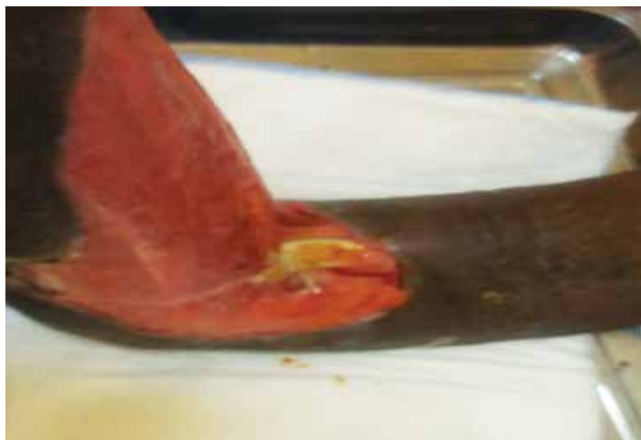
Fig 2. Fascitis necrosante en miembro superior (tras limpieza quirúrgica).

El uso de agentes despigmentantes estuvo asociado en todos los casos con otro factor de comorbilidad. Se reconoce como un factor predisponente en celulitis no necrosante 21 , pero aún no se ha demostrado su responsabilidad en fascitis necrosantes.