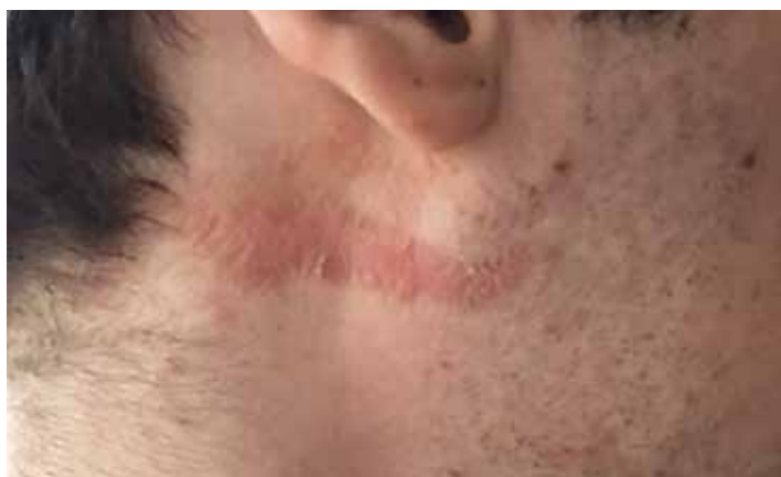
Fig 3. Hiperpigmentación postinflamatoria.

La prevención es fundamental: en las zonas y periodos de alto riesgo, (tras la estación de lluvia), los pacientes deben cerrar las ventanas y dejar las luces apagadas de noche 2 . Si se ve un escarabajo sobre la piel, es mejor soplarlo para que se vaya en vez de aplastarlo. En caso de contacto, hay que lavar la piel a conciencia para eliminar todos los restos de pederina. Se puede aplicar tintura de yodo para