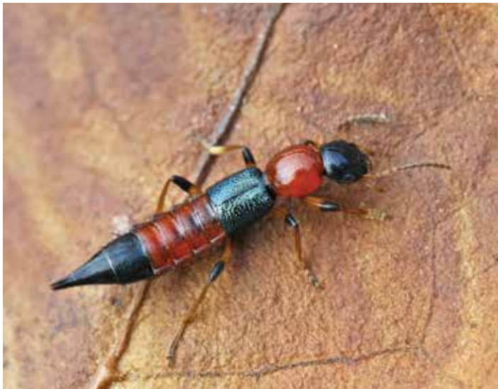
Fig 1. Escarabajo Paederus .

Los diagnósticos diferenciales incluyen la fotodermatitis de margarita, la dermatitis alérgica de contacto, el herpes simple o impétigo. Un historial claro excluiría el contacto con agentes botánicos fotosensibilizadores.